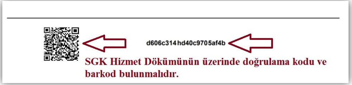
Resim 3- SGK Hizmet Dökümü örneği

mezuniyeti sonrasındaki hizmetler dikkate alınacaktır. Üzerinde doğrulama kodu ve barkod bulunan e-devletten alınan “SGK Hizmet Dökümü” mesleki tecrübeyi gösteren belge olarak kabul edilecektir.